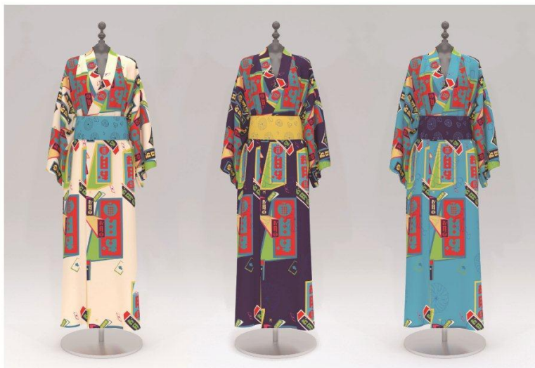
Dare to Dream Special Award