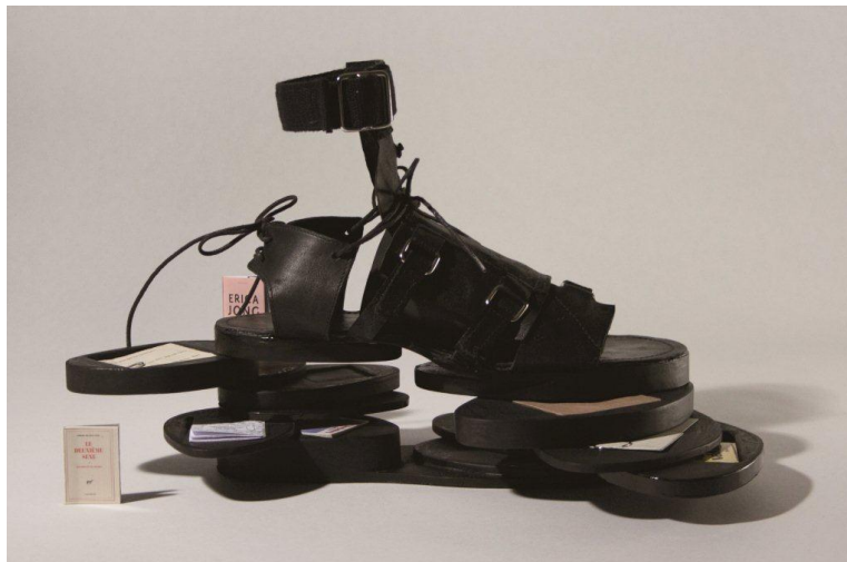
Dare to Dream Design Award